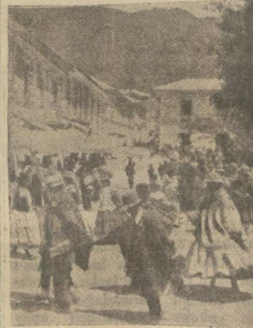
Paraguvay gerillerinden bir grup

Vaşington, 29 — Amerika hükümeti, birbirleriyle harp halinde bulunan Bolivya ile Paraguvaya hükümetlerine satılacak silâhlara ambargo konulması meselesine dair muhtelif devletlerden gönderilecek cevapları büyük bir alâka ile bekliyor. Bilhassa bu iki muharip devletin komşuları tarafından verilecek cevaplara çok ciddi bir ehemmiyet verilmektedir. Fakat Milletler Cemiyetinin bu hususta Japonyaya müraaat etmesi, hararetle münakaşa edilmektedir.